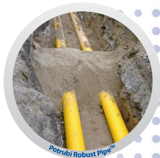
Potrubí Robust Pipe™

Na této stavbě v Liberci byla prováděna náhrada původního ocelového potrubí. S ohledem na problematické podmínky a skutečnost, že bylo nutno provádět většinu pokládky řízeným protlakem (pod komunikací apod.), byl zvolen potrubní systém Robust Pipe™. Jedná se o trubky z polyethylénu (typ PE 100) opatřené ochrannou vrstvou, která trubky chrání proti poškození jak ve výkopu, tak také při zatahování. Trubka obsahuje integrovaný signalizační vodič umožňující snadnou detekci potrubí v zemi.