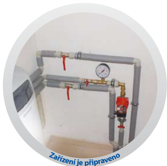
Zařízení je připraveno