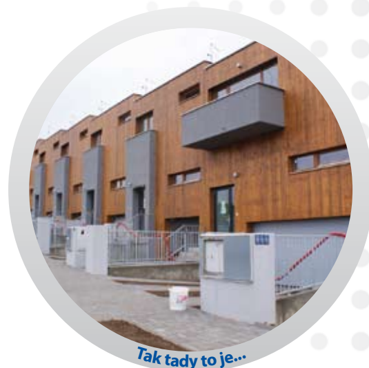
Tak tady to je...

Obyvatelé Prahy potřebují nové byty a Skanska Development je pro ně staví. V roce 2008 byla dokončena I. etapa stavby v atraktivním parkovém prostředí pražských Jinonic. Rodinné domy různého typu s působivým vnějším vzhledem přilákaly řadu zájemců. O atraktivitu pro nové obyvatele se stará i moderní technické zařízení budov, jehož veškeré trubní součásti dodala společnost Pipelife Czech s.r.o. Jsou samozřejmě z moderních plastů a zaručují prakticky bezúdržbový provoz pro několik generací svých uživatelů.