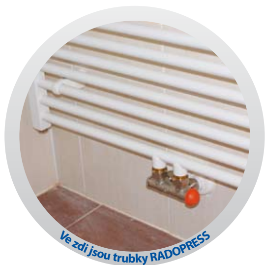
Ve zdi jsou trubky RADOPRESS