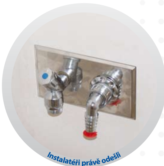
Instalatéři právě odešli