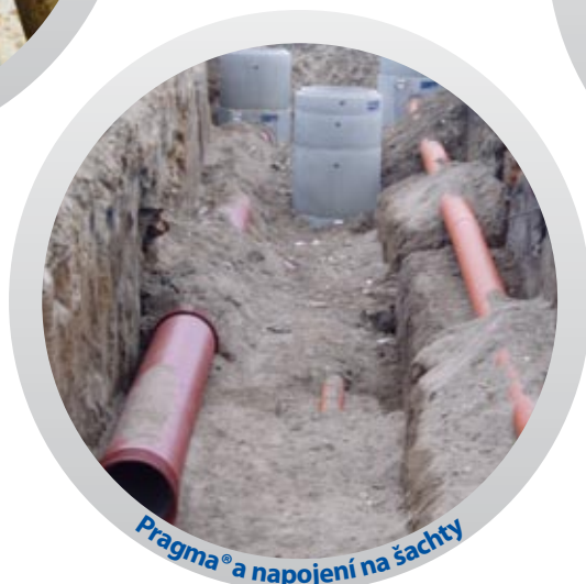
Pragma® a napojení na šachty