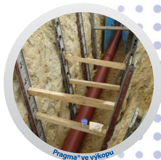
Pragma® ve výkopu