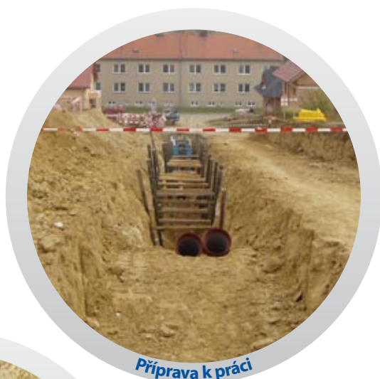
Příprava k práci