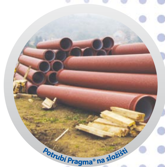
Potrubí Pragma® na složišti

Jako vhodný systém vybral projektant polypropylénové trouby Pragma® SN 8 z výroby Pipelife. Polypropylén je totiž velmi houževnatý jak za běžných, tak i nízkých teplot, což bylo vhodné vzhledem k realizaci stavby v zimních měsících. Systém Pragma® SN 8 (DN/OD) se může prokázat ekoznačkou Ekologicky šetrný výrobek, kterou uděluje MŽP. Pragma® SN 8 patří mezi systémy dlouhodobě osvědčené na českém trhu.