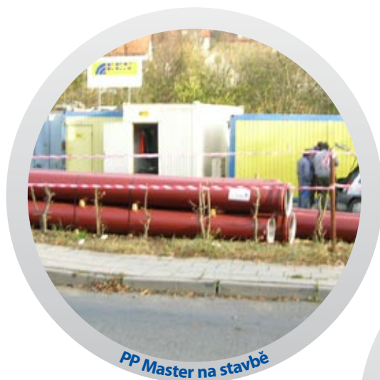
PP Master na stavbě