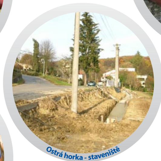
Ostrá horka - staveniště