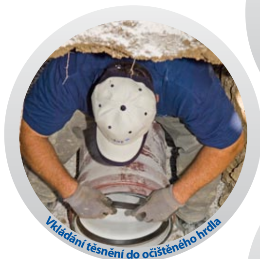
Vkládání těsnění do očištěného hrdla