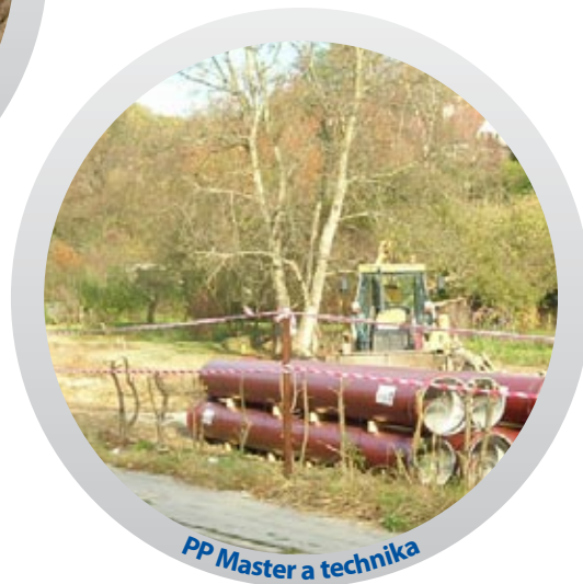
PP Master a technika