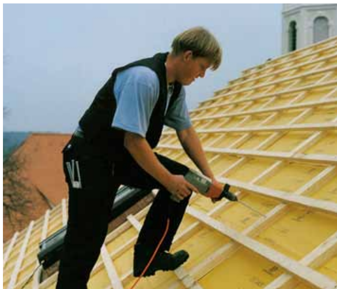
Uchycování kontralatí přes tepelnou izolaci