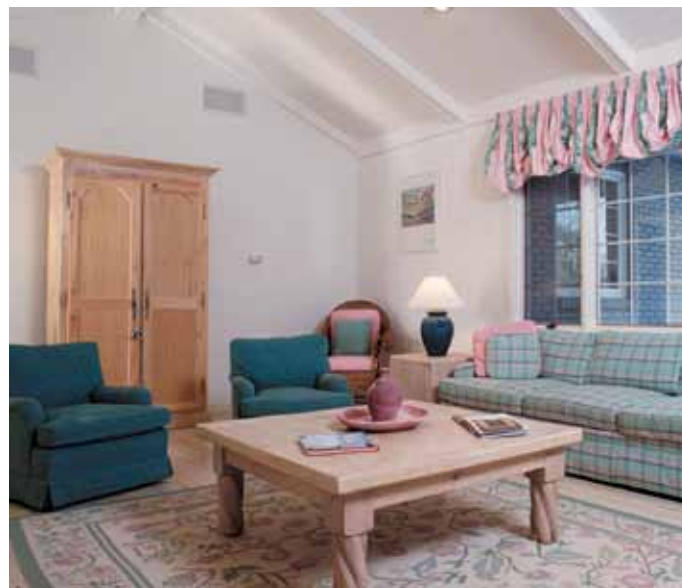
Nadkroevní zateplení umožňuje přiznat trámy střešní konstrukce v interiéru

Systém nadkroevní tepelné izolace je velice jednoduchý. Na běžnou nosnou konstrukci krovu (nejčastěji krokve) se aplikuje bednění, na které se položí parozábrana (doporučuji typ ISOVER VARIO KM Duplex UV) a na ni se již klade nosná část nadkroevního systému z trámů ISOVER TRAM